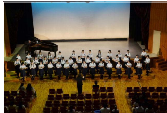
<舞台発表のトップを飾る合唱部>