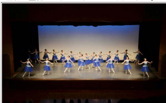
<2年バレエコースの発表>