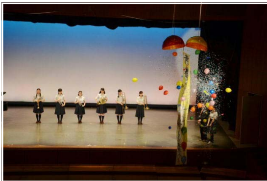
<オープニングセレモニー>