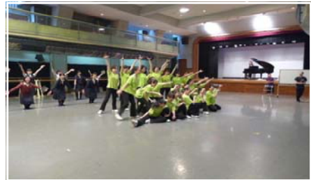
<楽苑ホールでのリハーサル風景>

2・3年音楽コース(24名)とダンス部(22名)が参加し、満場の観客から大きな拍手をいただくことができました。 ・日時：6月10日(金) 18:30~ ・会場：北とぴあ さくらホール ・プログラム 「Sound of Music」より R.Rodgers 作曲 英語 Ver. 「Edelweiss」 「Climb Every Mountain」 「Do・Re・Mi」