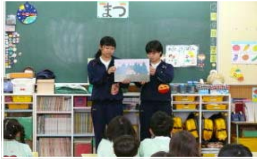
<幼稚園児への紙芝居の実習>

敷地内に併設されている日本音楽学校幼稚園と日本音楽学校保育園で、週あたり（1年次1コマ・2年次2コマ・3年次4コマ）の保育演習&実習