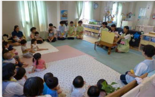
<半日保育実習：保育園での紙芝居>