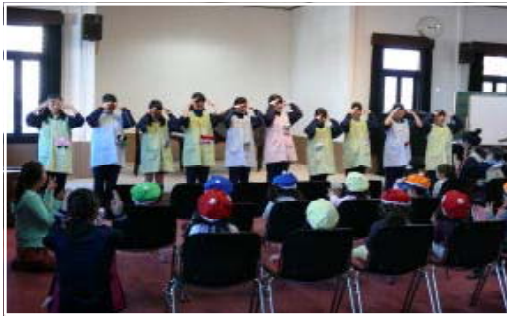
<保育園：手遊び「キラキラサントになっちゃった」>