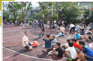
←幼稚園 「夕涼み会」 スイカ割り