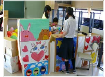
「イベントコーナー」