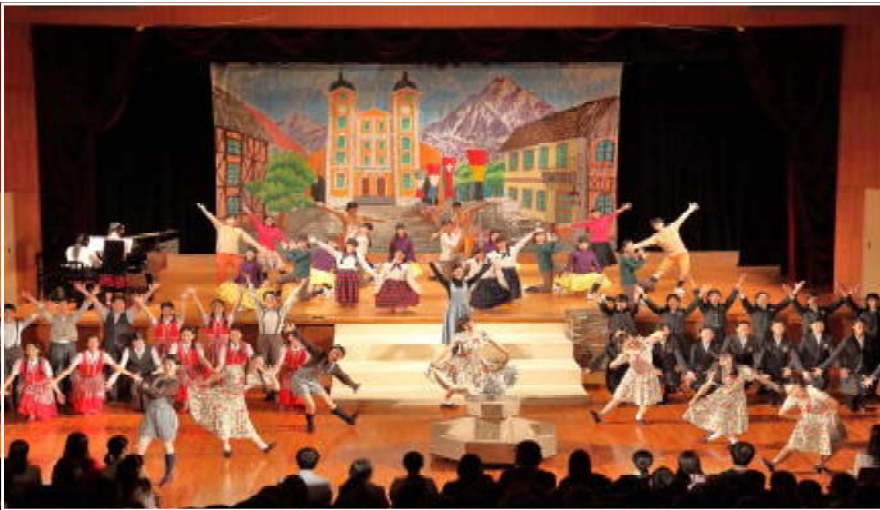
<「ドレミの歌」のシーンより>

※役者 (男性役も)・演奏・ダンス・舞台装置・照明まで、すべて生徒が行い、今年で 16年目 を迎える日音の一大イベントです。本校の特色と魅力が満載、毎年演出にも様々な工夫があり見応え十分です。是非一度、ご家族や友達をお誘いの上、ご鑑賞ください。生徒・教職員一同、心よりお待ちしております。